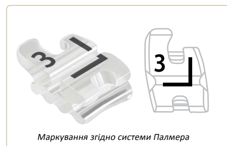
Маркування згідно системи Палмера

Більшість пацієнтів вміють оцінити естетичні переваги керамічних брекетів. Проте лише деякі знають які можуть виникнути проблеми під час дебондингу. У багатьох ортодонтів лише думка про те, що кераміка може розколотися чи тріснути стає основним критерієм вибору. Для того щоб активно зменшувати цей ризик, під час розробки брекетів GLAM®, FORESTADENT оперся на широкий досвід компанії у розробці генерації Quicklear. Необхідність зручності у використанні та відсутності можливих труднощів під час дебондингу надихнули компанію на створення брекетів GLAM®. Вони так спроектовані, щоб зняти їх можна було одним шматком, застосовуючи інструмент Пауля, без розколювань чи тріщин.